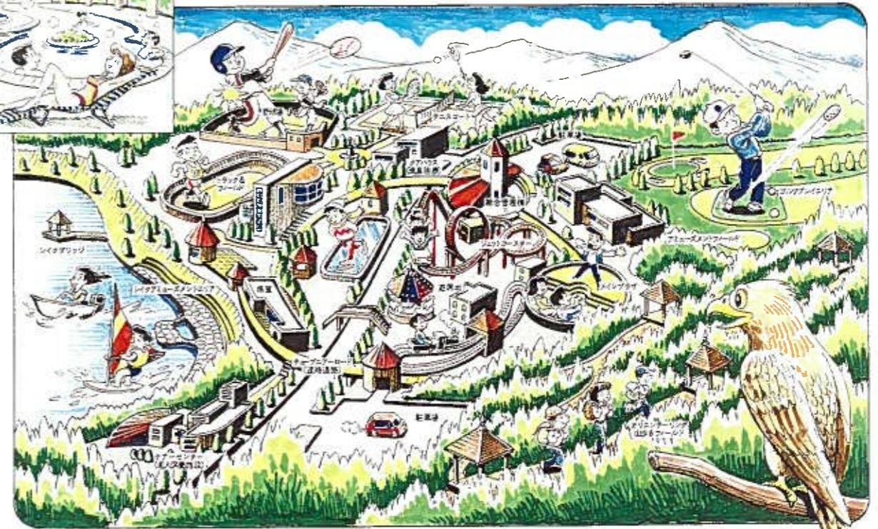
地場産業の育成など、若者が生きがいを持てるまちづくりのイメージ