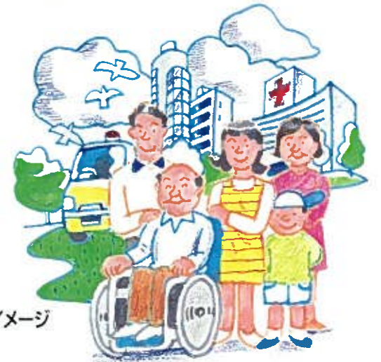
女性の社会参加の促進と福祉の向上のイメージ