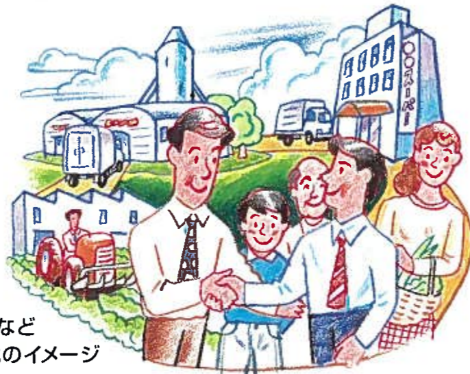
グリーンツーリズムなど農業と観光の一体化のイメージ