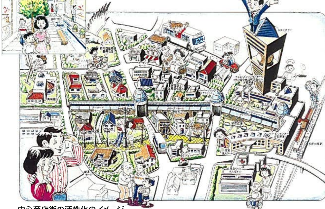
中心商店街の活性化のイメージ